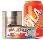
Latas de alimentos y bebidas