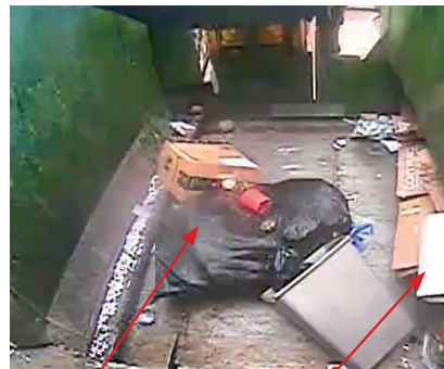
Bolsa de plástico