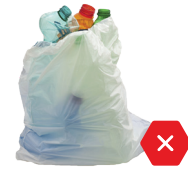
NO bolsas de plástico, mantenga los materiales reciclables sueltos