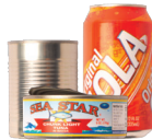
Food & Beverage Cans