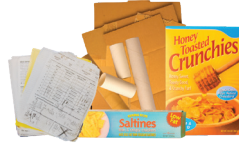
Papel, Cartón Aplanado y Cartón