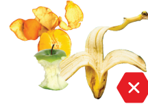
NO alimentos ni líquidos