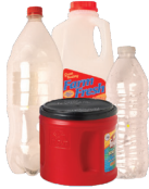
Botellas de plástico y jarras

Mantenga toda la basura fuera del carrito de reciclaje.