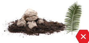
NO piedras, tierra ni hojas de palma