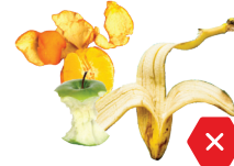
NO alimentos ni líquidos