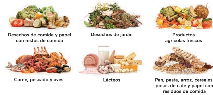
Desechos de comida y papel con restos de comida Desechos de jardín Productos agrícolas frescos Carne, pescado y aves Lácteos Pan, pasta, arroz, cereales, posos de café y papel con residuos de comida