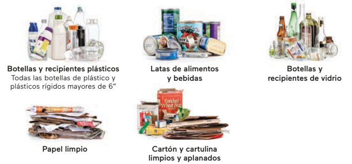
Botellas y recipientes plásticos Todas las botellas de plástico y plásticos rígidos mayores de 6" Latas de alimentos y bebidas Botellas y recipientes de vidrio Papel limpio Cartón y cartulina limpios y aplanados