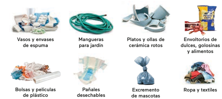
Vasos y envases de espuma Mangueras para jardín Platos y ollas de cerámica rotos Envoltorios de dulces, golosinas y alimentos Bolsas y películas de plástico Pañales desechables Excremento de mascotas Ropa y textiles