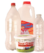
Botellas, recipientes, jarras, frascos y bañeras de plástico.