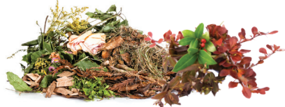
Desechos de jardín.