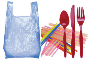
Bolsas, popotes y utensilios de plástico.