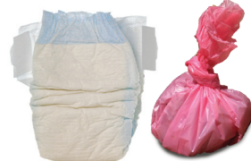
Pañales sucios y desechos de mascotas.