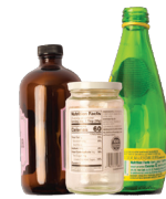
Botellas y frascos de vidrio.