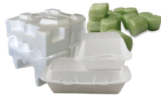
Espuma de poliestireno.