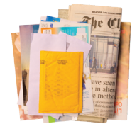
Papel suelto (no papel triturado)