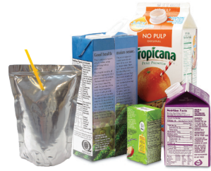
Bolsas/cajas de jugos, y cajas de cartón (con tapas plásticas).