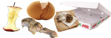
Restos de alimentos y papel manchado con comida.