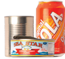
Latas de aluminio, acero y hojalata.