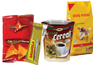
Envolturas de alimentos y bolsas de comida para mascotas.