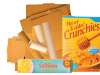
Cartones aplanados y papelógrafos (no empaquetados ni atados)